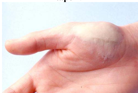
Etape N° 2

Appliquer le Plasto-nat au doigt en tirant bien vers l'extérieur.