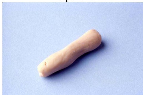
Etape N° 1

Façonner un morceau assez gros de Plasto-nat de forme allongée.