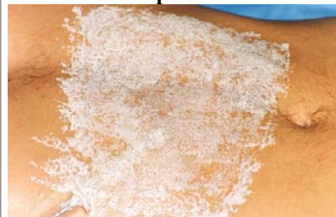
Etape N° 3

A l'aide de l' Éponge mousse poser 3 couches de Latex sécher chacune au séchoir. (par petites touches)