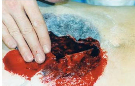
Etape N° 8

Ne pas hésiter à badigeonner l'ensemble de la réalisation avec du Sang Liquide .