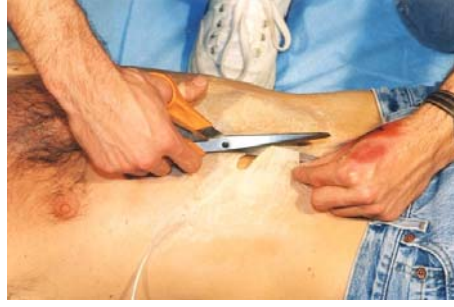
Etape N° 5

Une fois le Latex posé en 3 couches, appliquer de la Poudre libre à l'aide de la Houppes (ceci évitera au Latex de coller). Remarquez que le Latex est moins blanc