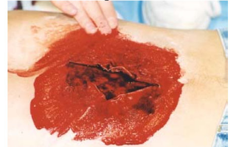
Etape N° 9

Ne pas hésiter à badigeonner l'ensemble de la réalisation avec du Sang Liquide .