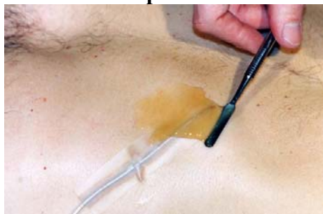
Etape N° 1

Poser à l'aide de la brosse plate N°6 la Protection Latex sur l'ensemble de l'abdomen. Appliquer à la Spatule le Produit simulation Peau (en fine couche). Vous pouvez aussi mettre une tubulure avant le Produit Peau . (voir pose de tubulure pour hémorragie)