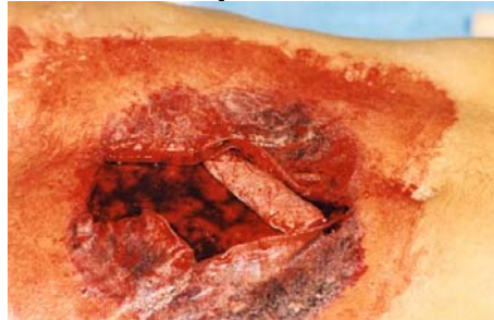
Etape N° 11

Astuce : avec un kleenex absorbez le surplus de Sang , cela donnera un effet de transparence.