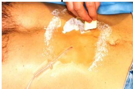
Etape N° 2

A l'aide de l' Éponge mousse poser 3 couches de Latex sécher chacune au séchoir. (par petites touches)