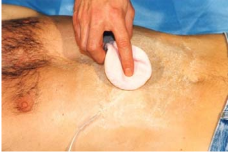
Etape N° 4

Une fois le Latex posé en 3 couches, appliquer de la Poudre libre à l'aide de la Houppes (ceci évitera au Latex de coller). Remarquez que le Latex est moins blanc