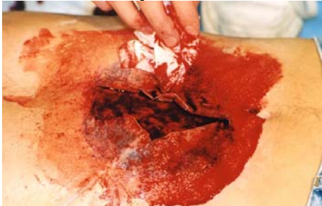
Etape N° 10

Astuce : avec un kleenex absorbez le surplus de Sang , cela donnera un effet de transparence.