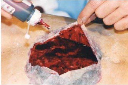
Etape N° 7

A partir de cette étape vous pouvez colorer l'ensemble de la réalisation avec du Sang Liquide .